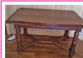
Cause déménagement, vend Table de salon chêne massif avec deux rallonges sur les côtés. Prix demandé 90€ (négociable). Tél. 06.48.99.36.86 après 19h.