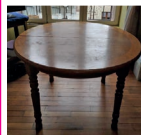
Cause double emploi, vend Table ronde en chêne avec une rallonge. Très bon état. Prix demandé 120€ négociable. Tél. 06.48.99.36.86 après 19h.