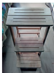
Cause double emploi, vend Table de salon chêne massif avec deux rallonges sur les côtés. Prix demandé 90€ (négociable). Tél. 06.48.99.36.86 après 19h.

Achète, à particulier ou professionnel, tous métaux, zinc, plomb, batteries, laiton, câbles électriques, cuivre (pompes à sulfater, chaudières, tuyauterie). Tél. 06.40.18.04.56.