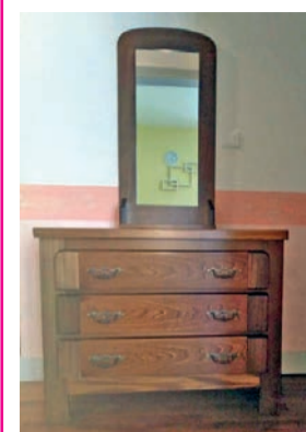
Vends Commode, orme massif, avec miroir. 60€ négociable. Tél. 06.48.99.36.86 après 19h.

Pour DEMANDER TROUVER VENDRE ACHETER... PENSEZ À NOS PETITES ANNONCES