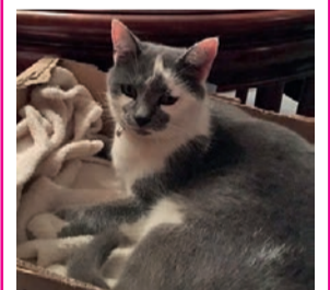
Femelle disparue depuis le 29/11 à Bozouls. Elle est pucée et portait un collier rouge au moment de sa disparition. Merci de votre aide pour la retrouver. Tél. 06.71.62.80.66.