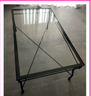
Vends Table Basse de salon plateau en verre et armature fer forgé Drimmer, 120x70. 30€. Tél. 07.85.52.76.68.