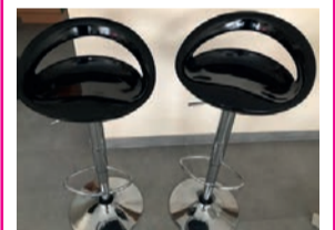
Vends 2 Tabourets de bar laqués noir. Prix 30€ les deux. Tél. 07.85.52.76.68.