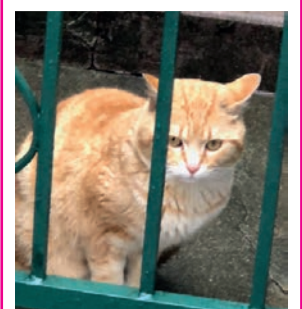
Le ou la propriétaire de cet adorable chat peut le récupérer en téléphonant au 06.44.23.59.48.

Recherche tracteurs, presse à balle ronde, presse MD, épandeur fumier, charrue Kverneland, divers mat. agricole et vieux camions. Tél. 06.81.21.96.17.